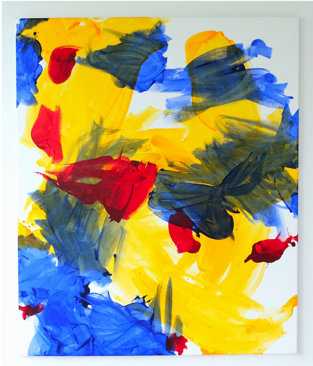
“crimsonweightiness“, 2022, Acryl auf Leinwand, 120 x 100 cm