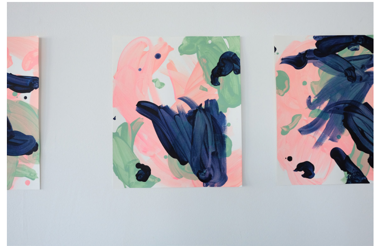
„whitecansometimesbegolden“ 2022, Acryl auf Leinwand, 60 x 50 cm & “singindigo“ 2022, Acryl auf Papier, je 35 x 30 cm