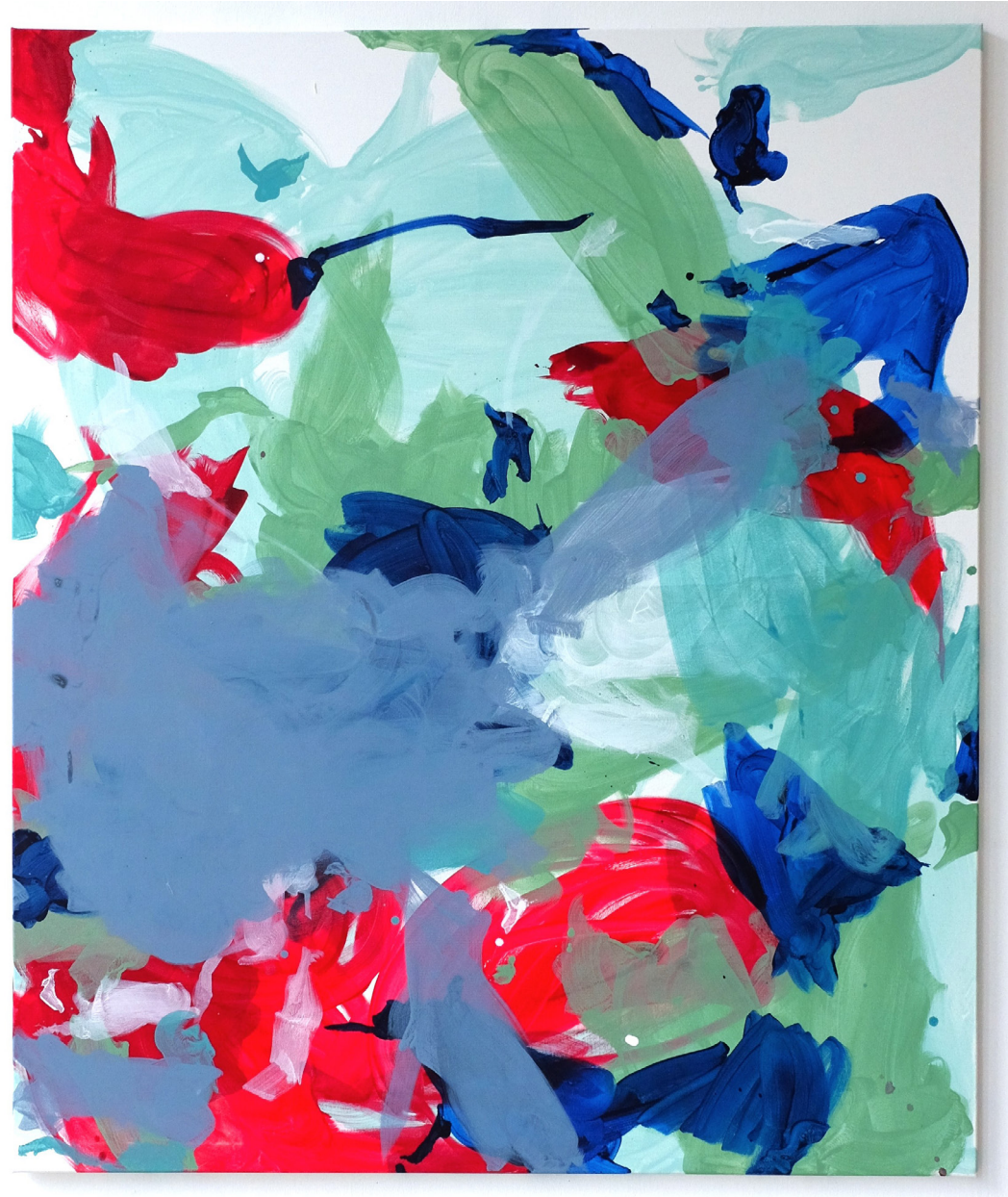
“orangebliss‘ 2021, Pigmente & Acryl auf Papier, 35,5 x 29,5 cm