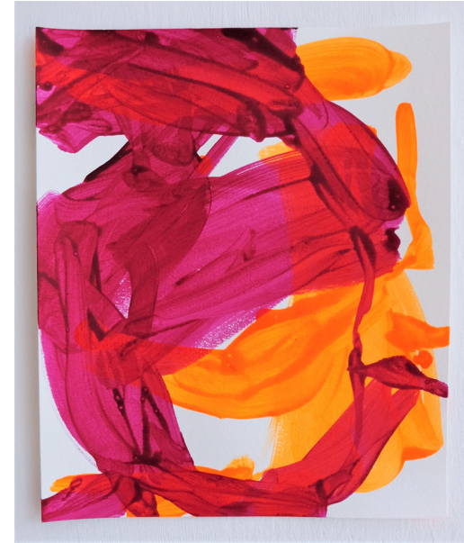
“mauvehealingpain“ 2021, Pigmente & Acryl auf Papier, 35,5 x 29,5 cm & 28,5 x 24 cm