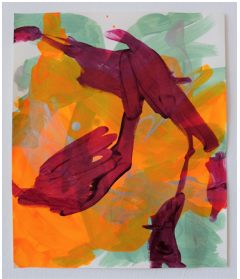
„mauvehealingpain“ 2021 Pigmente & Acryl auf Papier 35,5 x 29,5 cm

11./12. 2021 Aufenthalt im Gastatelier/offenes Gastatelier (Raketenstation) der Stiftung Insel Hombroich