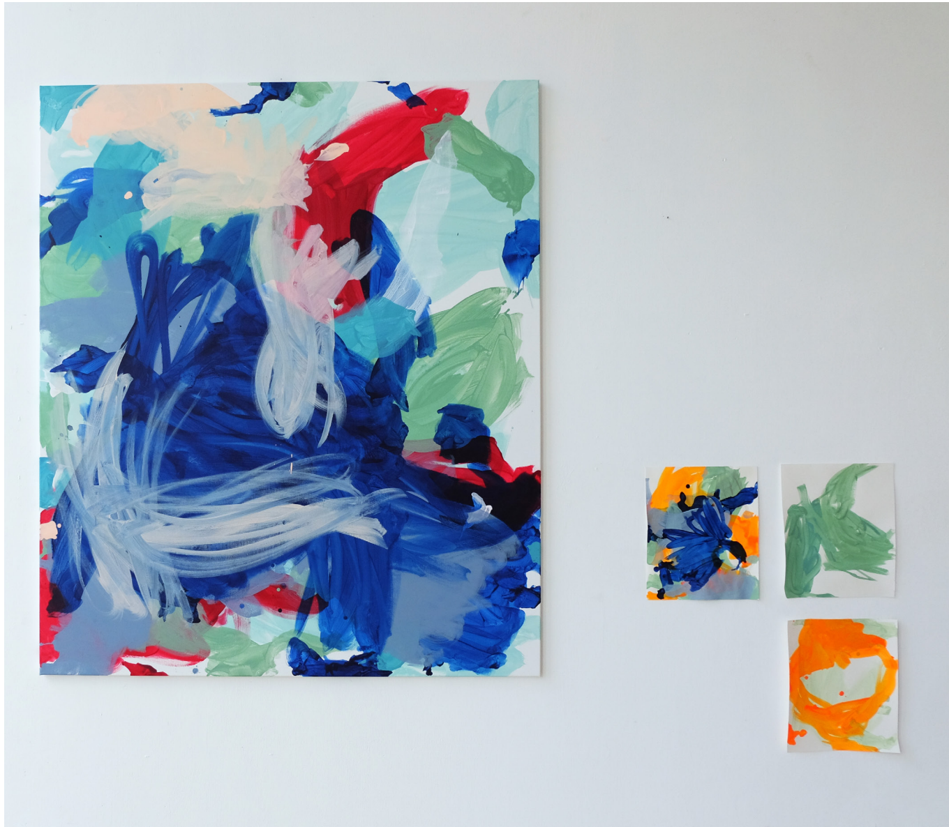
„naplesorangeovertake“, 2021, Pigmente & Acryl auf Leinwand, 160 x 135 cm