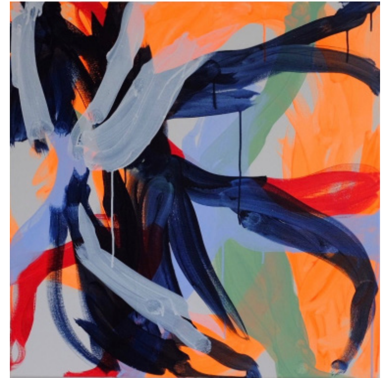
„outofthedark“ 2020, Acryl auf Leinwand, 80 x 80 cm