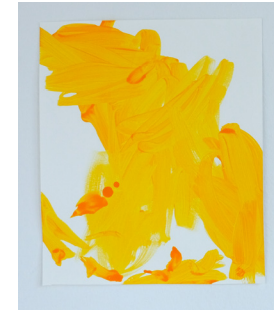
2022, `indiangold` Acryl auf Leinwand, 35 x 30