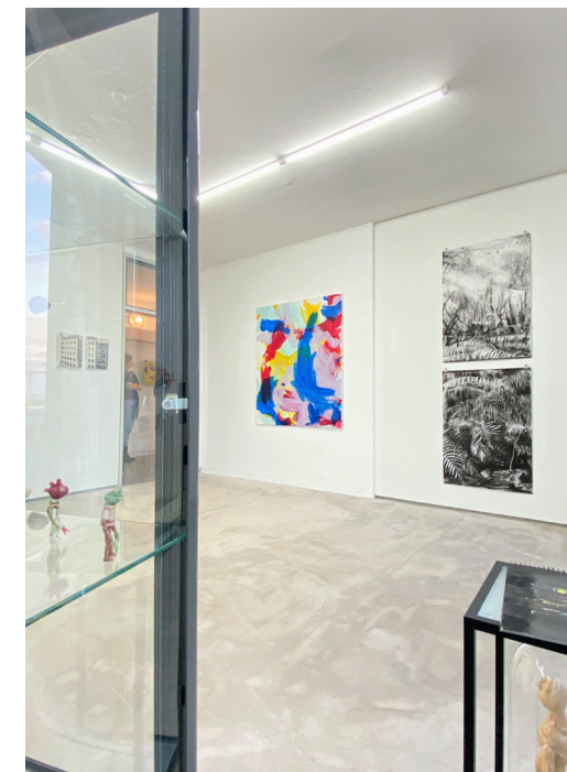
“winsorblues“, 2022, Acryl auf Leinwand, 140 x 120 cm (vorne links: Nieves de la Fuente; rechts: Maike Ellers & Broke Boys)