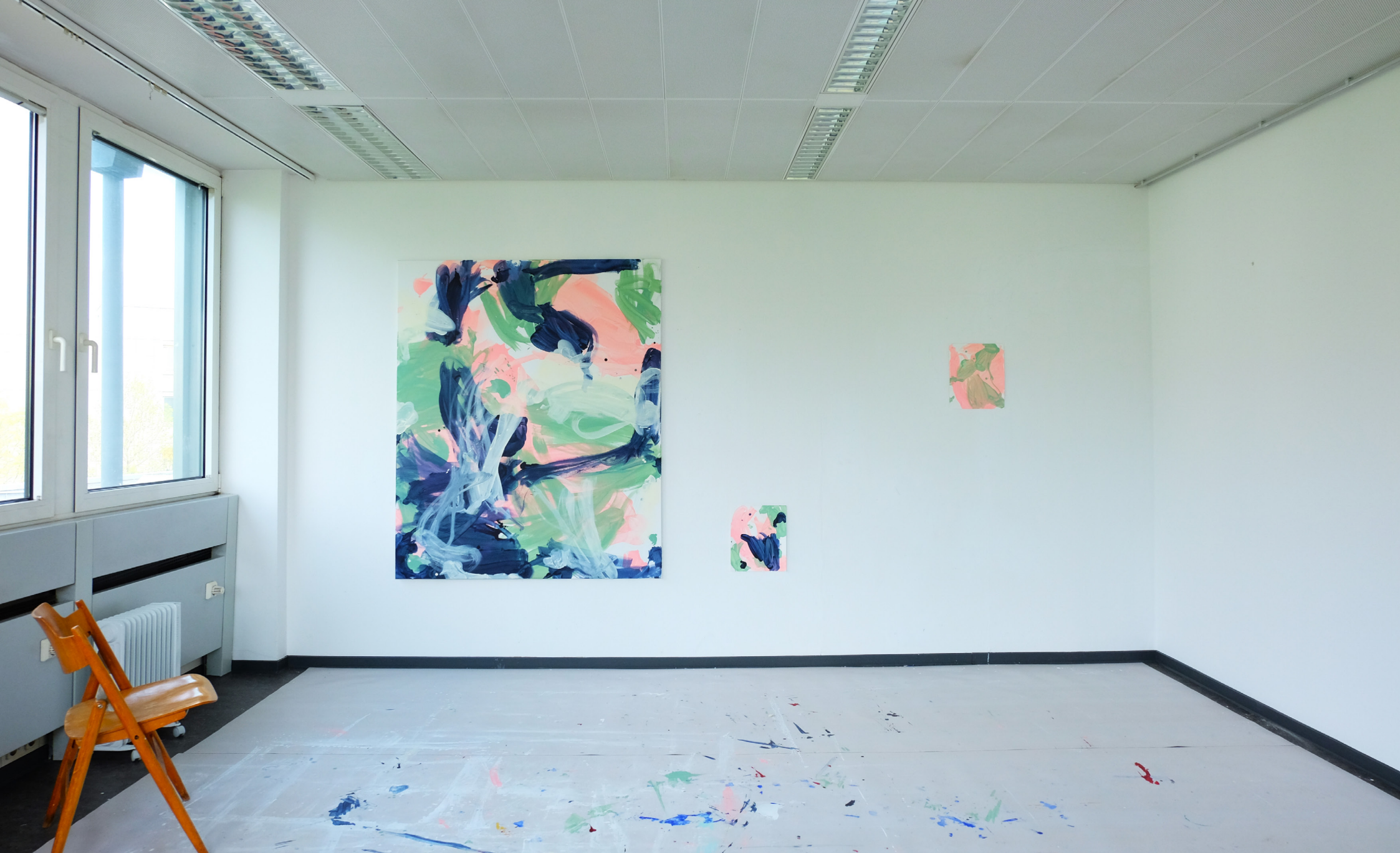
05.2022, Offene Ateliers, Kunstquartier44, Köln