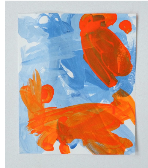
„besidesnaplesorangetroublemaker“, 2022, Acryl auf Papier, 35 x 29,7 cm „orangeincomprehensibility“, 2022, Acryl auf Papier, 25 x 21 cm