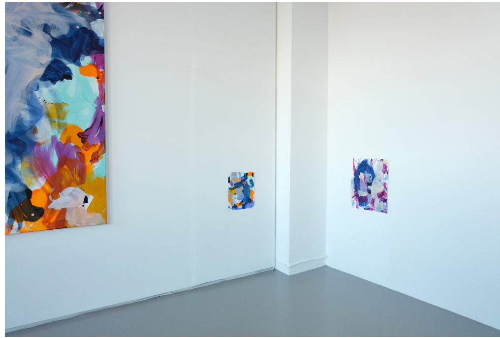
2022, "naplesorangetroublemaker", 2022, Acryl auf Leinwand, 170 x 140 cm