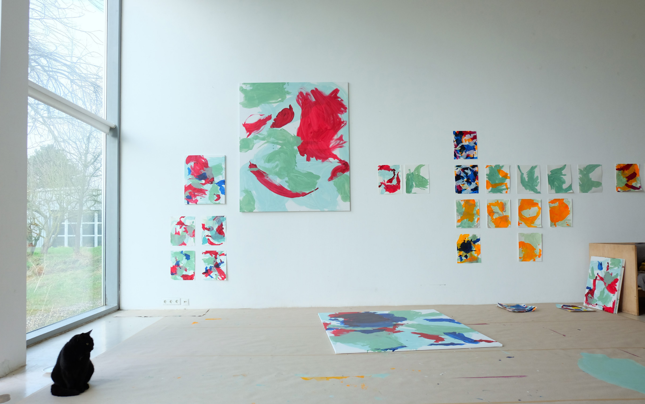
11./12. 2021 Aufenthalt im Gastatelier/offenes Gastatelier (Raketenstation) der Stiftung Insel Hombroich