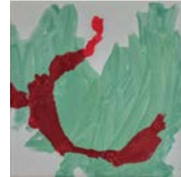
2021, „carmineredbounces“ Acryl auf Leinwand, 30 x 30 cm