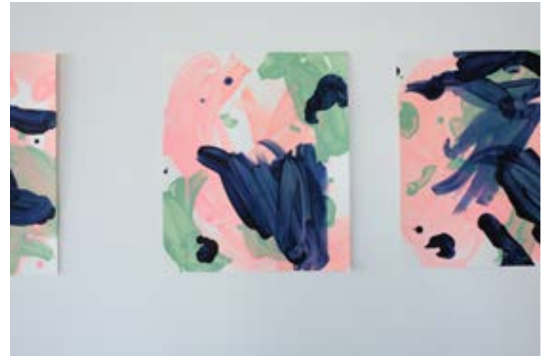
2022, "singingindigo", 2022, acrylic on canvas, 120 x 105 cm & acrylic on paper, 35 x 30 cm