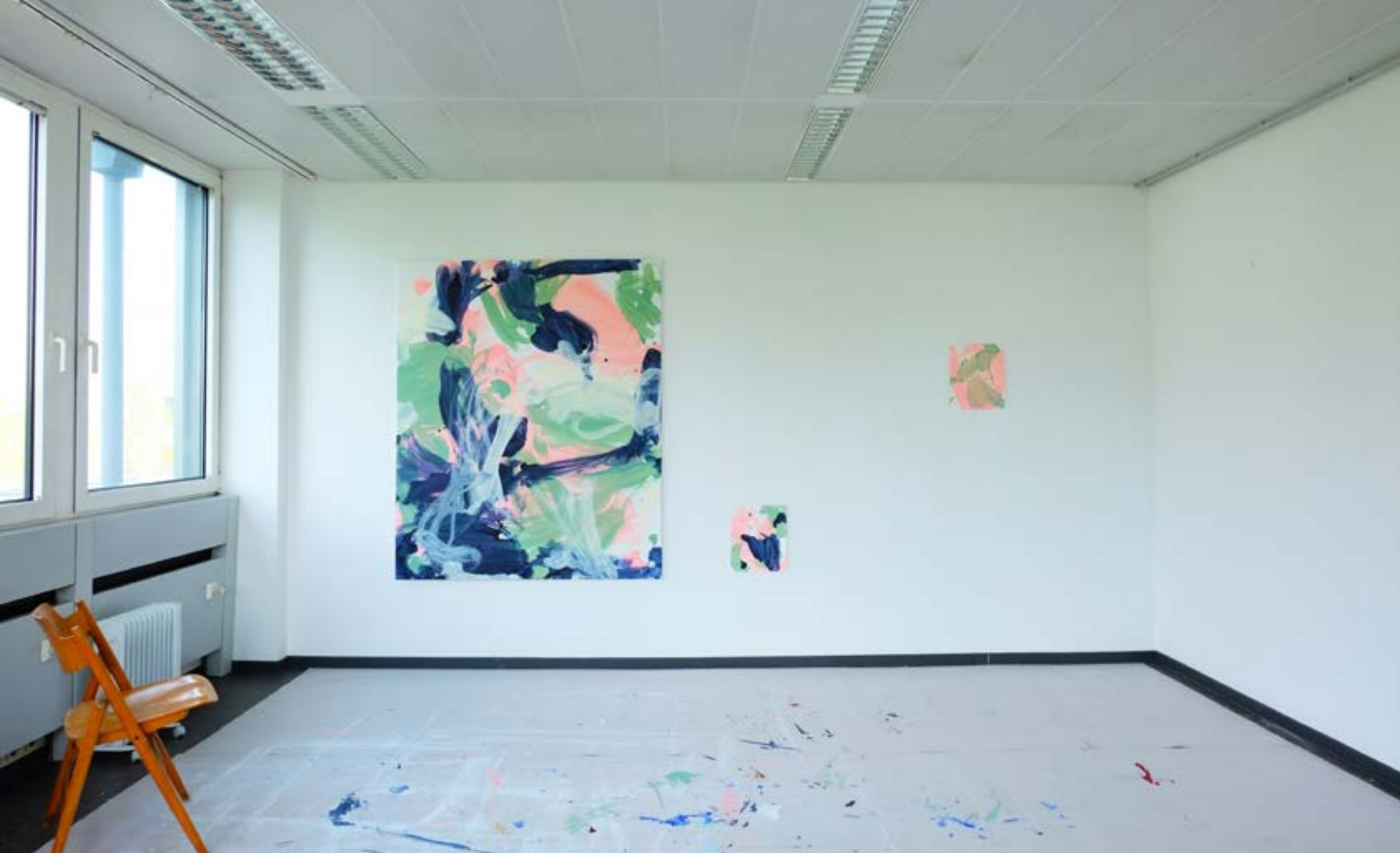
05.2022, offenes Atelier, Kunstquartier44, Köln