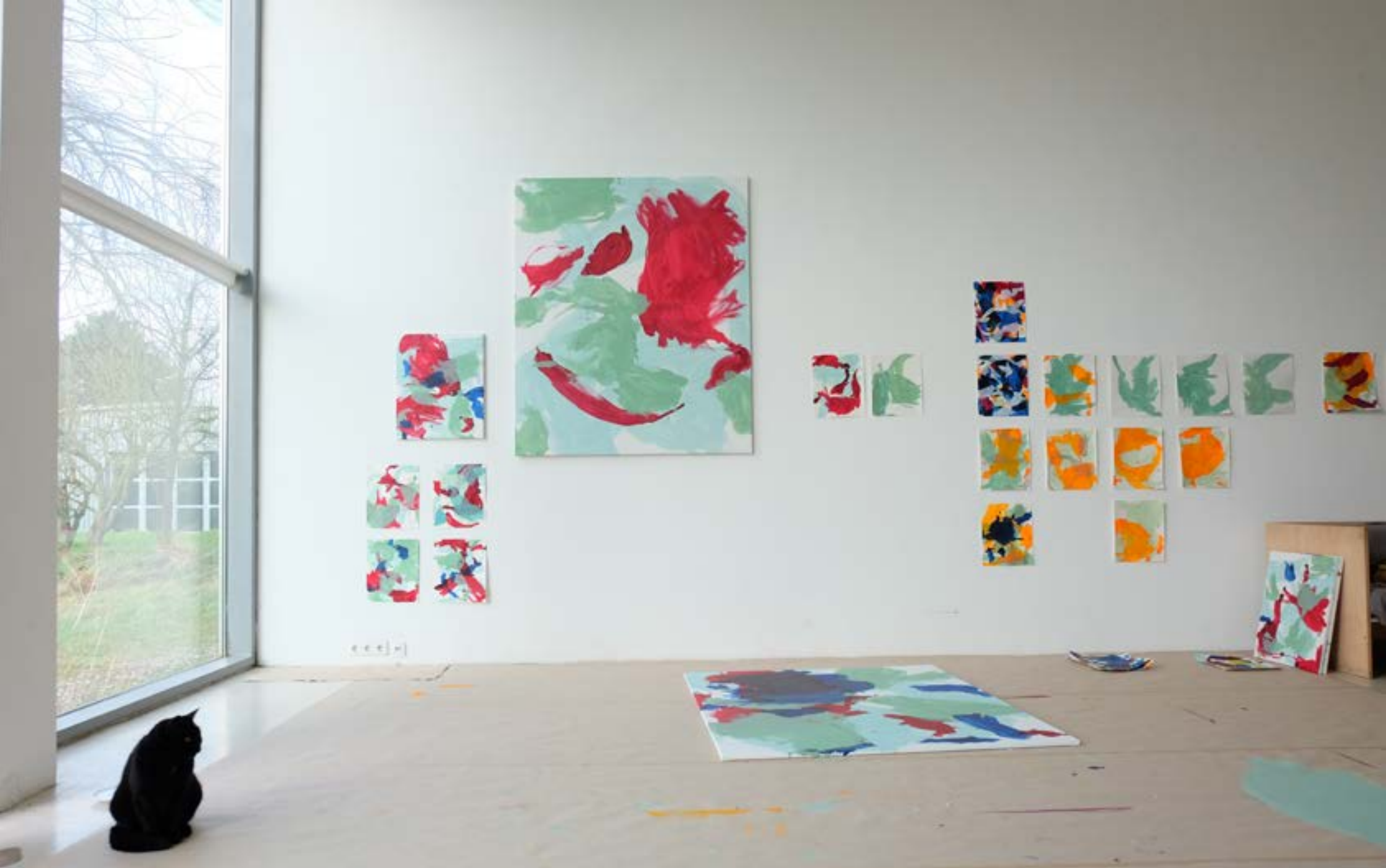
11./12. 2021 Aufenthalt im Gastatelier/offenes Gastatelier (Raketenstation) der Stiftung Insel Hombroich