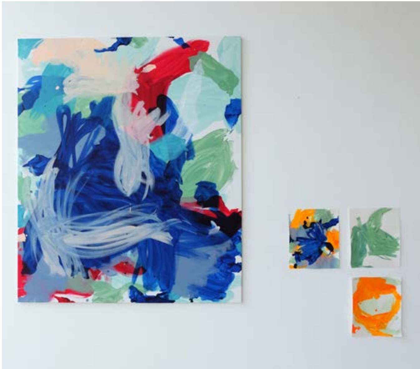
„naplesorangeovertake“, 2021, pigments and acrylic on canvas, 160 x 135 cm