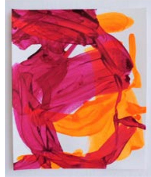
2021 "mauvehealingpain", pigments & acrylic on paper, 35,5 x 29,5 cm & 28,5 x 24 cm