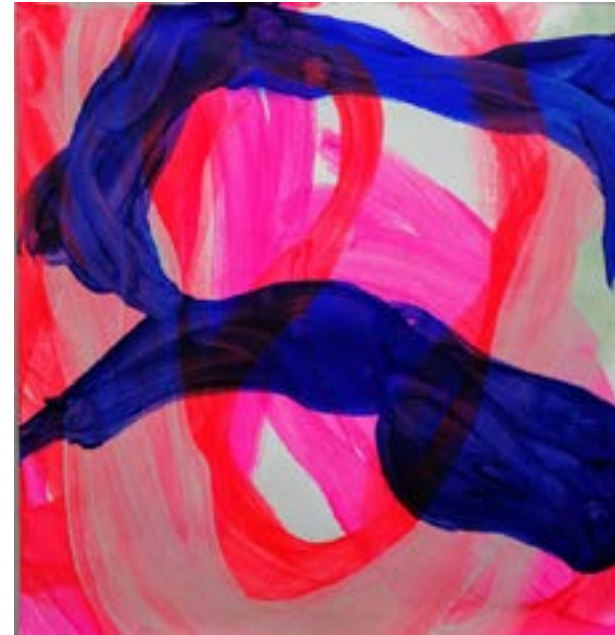
2019, o.T. Acryl auf Papier, 50 x 50 cm