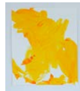
2022, `indiangold` acrylic on paper, 35 x 30 cm