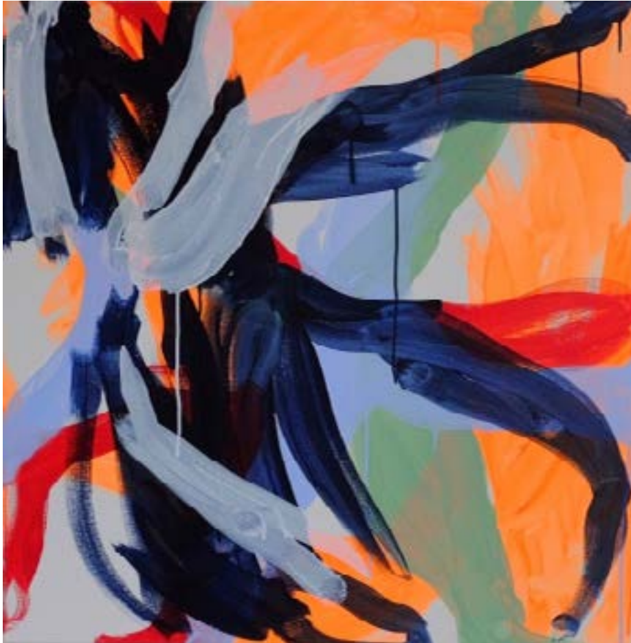
2020, „outofthedark“ Acryl auf Leinwand, 80 x 80 cm