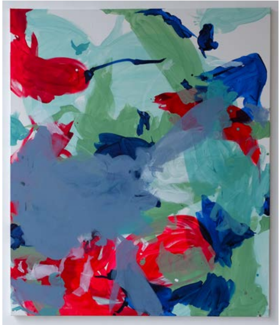
“orangebliss’ 2021, pigments & acrylic on paper, 35,5 x 29,5 cm