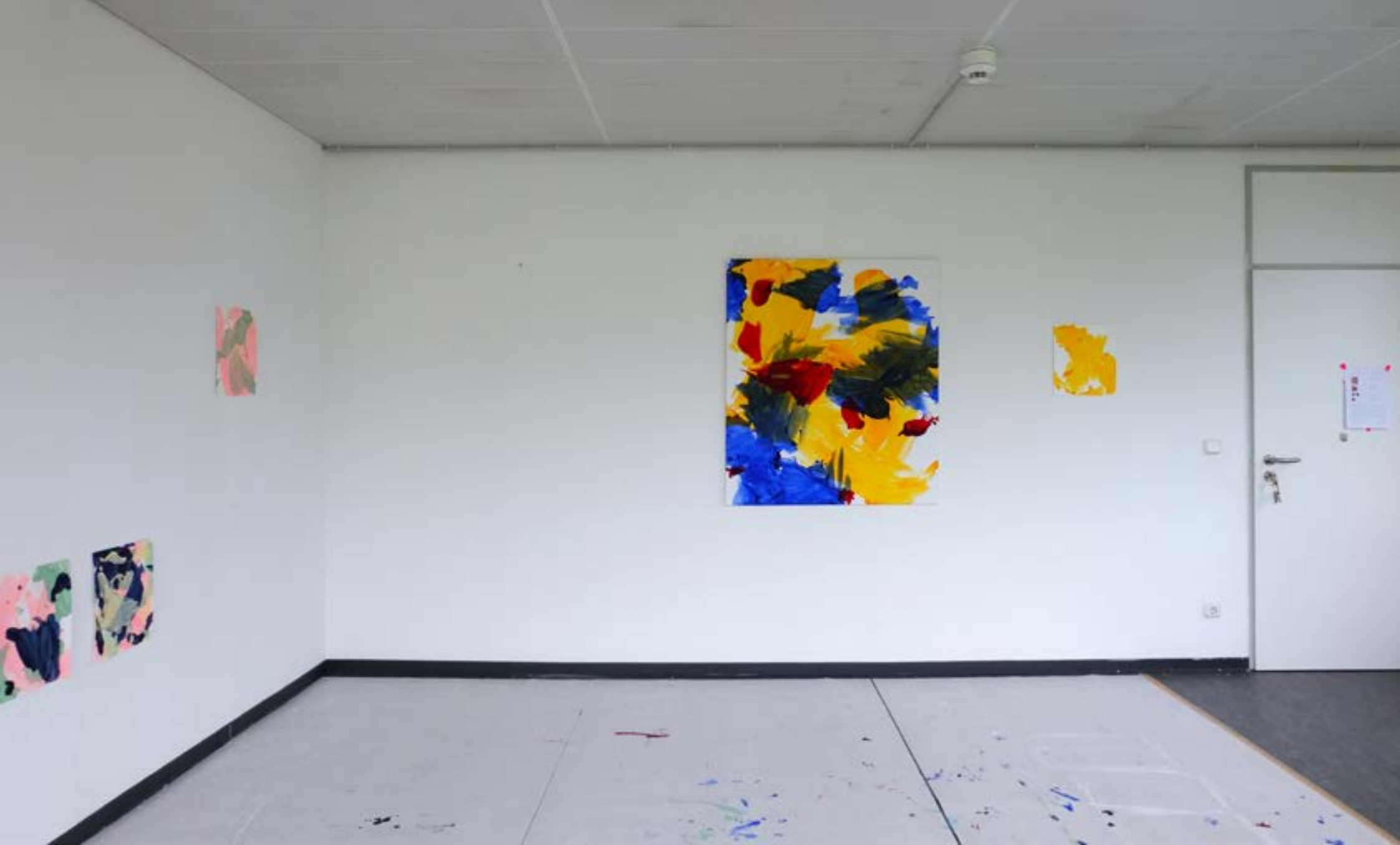
05.2022, offenes Atelier, Kunstquartier44, Köln