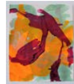
„mauvehealingpain“ 2021 pigments & acrylic on paper 35,5 x 29,5 cm

11./12. 2021 Aufenthalt im Gastatelier/offenes Gastatelier (Raketenstation) der Stiftung Insel Hombroich