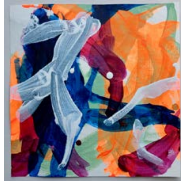
2021 „whiteisconsiliatory“, Acryl auf Papier, jeweils 30 x 30 cm