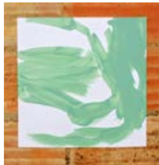
2020, o.T. Acryl auf Papier, 29,7 x 29,7 cm