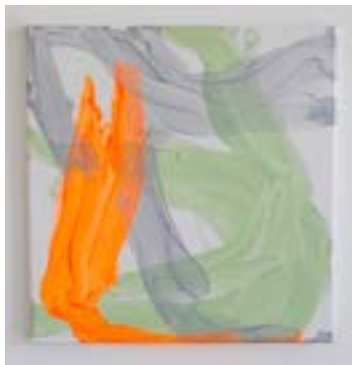
2020, „silverdream“ Acryl auf Leinwand, jeweils 35 x 35 cm